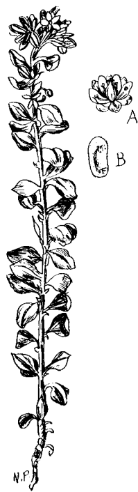
FIG. 45. — Telephium Imperati : A, Fleur ; B, Graine.